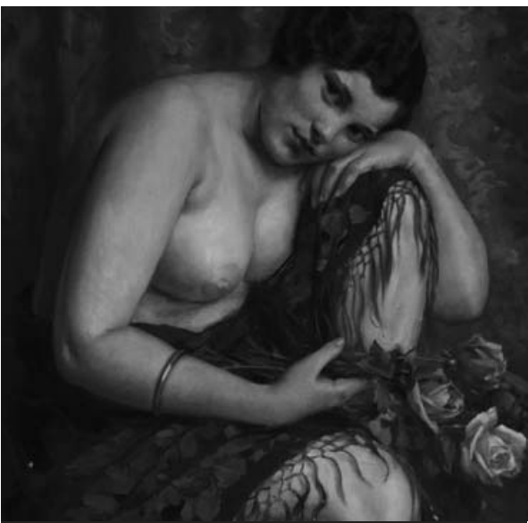
Galerie hl. města Prahy Městská knihovna – 2. patro